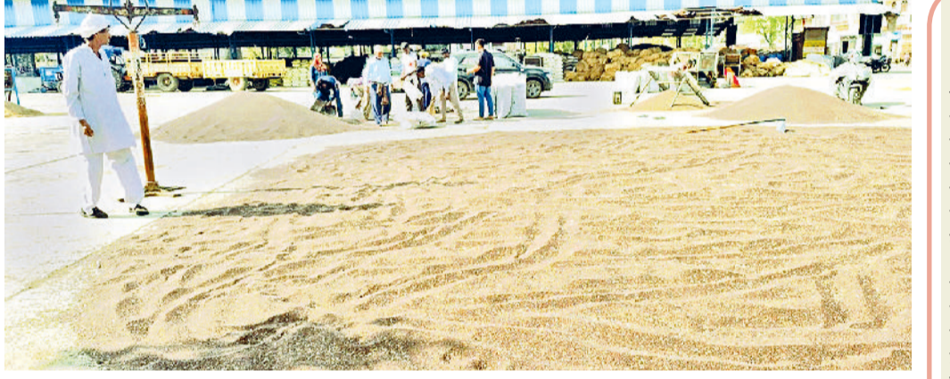
भिवानी। अनाजमंडी में सरसों सुखाते किसान।

गेट पास नम्बर प्लेट पर स्कैच पैन से अंकित नम्बरों पर भी जारी हो जाएगा ऐसी व्यवस्था सभी मंडियों में की गई