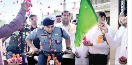
भवानीखेड़ा। स्वच्छ हरियाणा स्वस्थ हरियाणा नशा मुक्त हरियाणा के तहत साइकिल यात्रा को रवाना करते हुए।