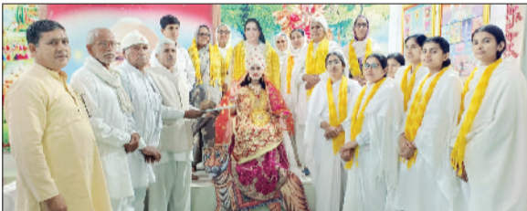
भिवानी। चैतन्य देवी रूप में मां दुर्गा की पूजा अर्चना करते बीके भाई बहन।