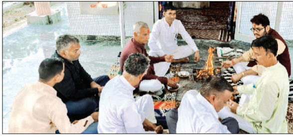
भिवानी। जनस्वास्थ्य विभाग परिसर स्थित मंदिर में पूजा अर्चना करते हुए।

खास बातें ■ रामनवमी और स्वामी रामदेव के संन्यास दिवस पर जनस्वास्थ्य विभाग मंदिर प्रांगण में कार्यक्रम आयोजित ■ कार्यक्रम की शुरुआत पूर्ण विधि-विधान और वैदिक मंत्रोच्चार से हुई, लोगों ने विश्व शांति की कामना की