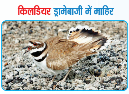
किलडियर ड्रामेबाजी में माहिर

किलडियर मुख्य रूप से उत्तरी, मध्य और दक्षिणी अमेरिका के खुले, घास वाले मैदानों, खेतों, गोल्फ कोर्स और जल निकायों के किनारे पाए जाते हैं। ये कनाडा, संयुक्त राज्य अमेरिका, मैक्सिको और कैरिबियन कंट्रीज में भी बड़ी संख्या में पाए जाते हैं। यह प्लोवर प्रजाति का एक तटीय पक्षी है, जो जमीनी इलाकों में रहता है। जब कोई शिकारी, जैसे- कुत्ता, लोमड़ी या इंसान इसके जमीनी घोंसले के करीब आता है, तो मादा या नर किलडियर घोंसले से दूर जाकर जमीन पर लेट जाता है। यह अपने पंख को इस तरह फैलाता और फड़फड़ाता है, जैसे